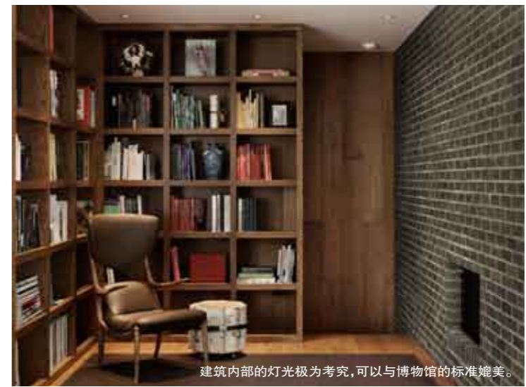
建筑内部的灯光极为考究，可以与博物馆的标准媲美。