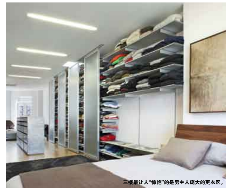
三楼最让人“惊艳”的是男主人庞大的更衣区。