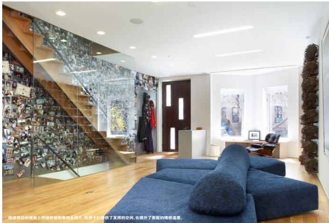
楼梯背后的墙面上用磁铁附着着很多照片,给孩子们提供了发挥的空间,也提升了家庭的情感温度。