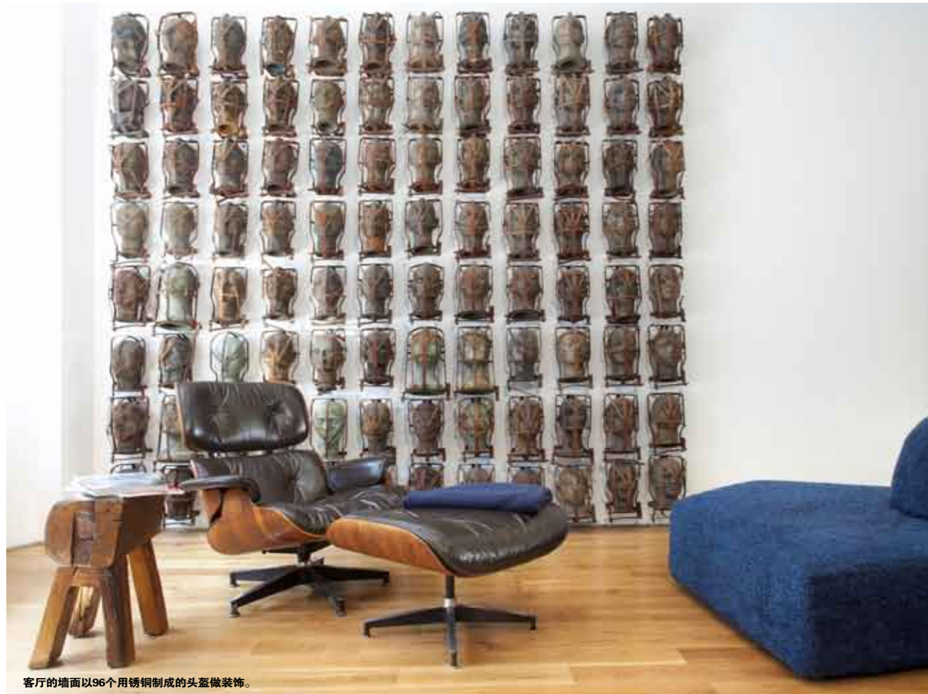
客厅的墙面以96个用锈钢制成的头盔做装饰。